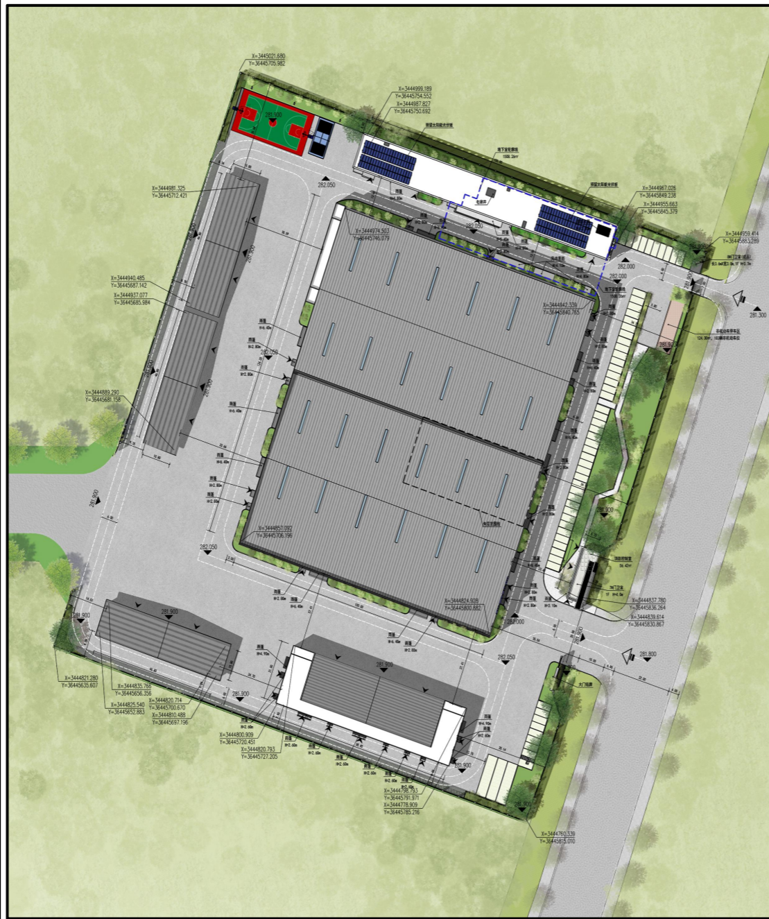
规划审批项目平面图

建设项目公示 建设单位: 四川腾航科技有限公司 设计单位: 唐山市规划建筑设计研究院有限公司 建设地点: 达州高新区河市镇河市机场旁 建设单位申请对无人机总装生产基地及飞行运营服务基地项目进行规划核实,经我局现场核实,该项目现状建筑外立面、整体布局、功能结构与方案基本一致,现状单体建筑7个,总建筑面积20138.99m 2 ,总计容面积33555.52m 2 ,容积率0.84,绿地率8.00%,建筑密度42.76%,停车位63个。 本公示内容自2026年3月12日起,公示时间为七个工作日,如有意见请在公示期间来电或书面意见反馈给达州市自然资源和规划局高新区分局。 电话:0818-3199019 (注:如对公示内容有不明确之处可向我局咨询。) 达州市自然资源和规划局高新区分局 2026年3月12日 附注: 1、意见反馈方式: (1)信函反馈意见:请邮寄至达州高新区长田新区创业一街三中心办公大楼903办公室(规划科); (2)咨询电话:0818-3199019。 2、有效反馈意见期:信函反馈意见截止日及来电反映时间不应超过意见反馈期最后一天,逾期视为无效意见,不予采纳。 3、有效反馈意见:注明真实联系人姓名、联系电话、联系地址,如反馈意见不准确或不完整、无法及时进一步核对有关情况的,视为无效意见。 4、查询地址: http://www.dzgxq.gov.cn/